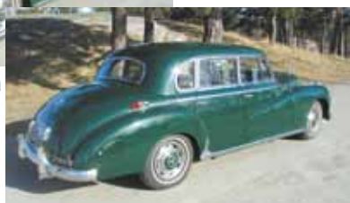
oikea sivu takaa