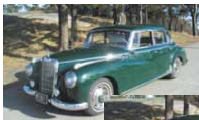
vasen sivu edestä