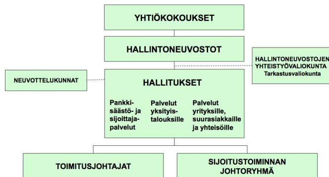
Kuva: Tapiola-ryhmän hallinnollinen rakenne (ilman Eläke-Tapiolaa)